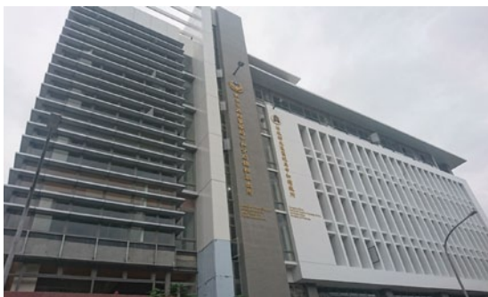
中和聯合大樓現況