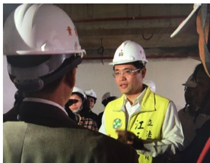
中和聯合大樓會勘

進度追蹤： 預計 106 年 2 月底完工，俟使照核發後，錦和派出所預計 7 月進駐，另中和稽徵所預計 8 月 21 日前進駐，市府由於預算不足無法買回部分建築空間，故北區國稅局決定以招商附帶條件方式滿足市民活動中心之需求。